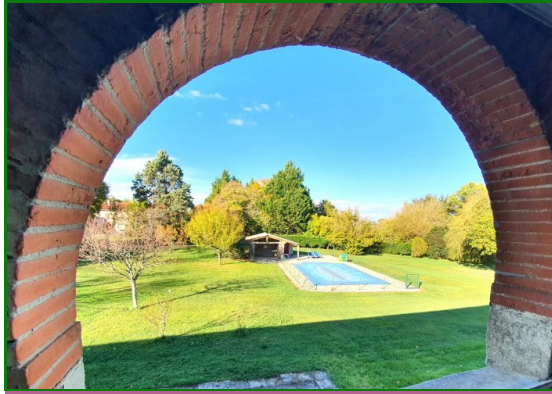
Coup de cœur

Référence VM4107, Mandat N°5495 Proche Caraman. Très belle propriété qui vous offre le calme et la sérénité tout en étant proche des commodités.